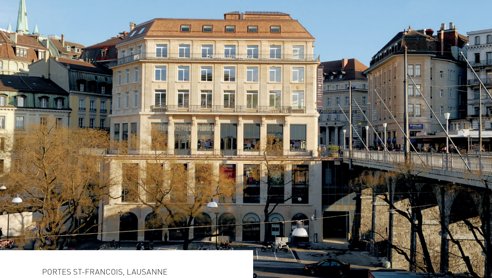
PORTES ST-FRANCOIS, LAUSANNE